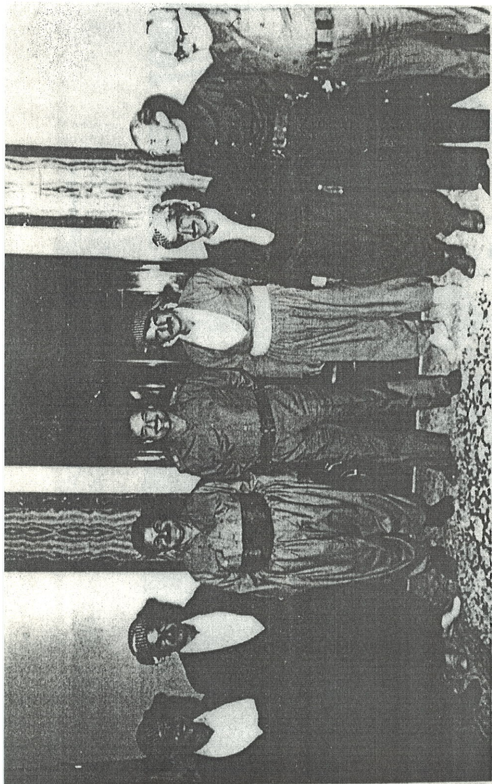
بغدا - کانونی په کمپی ۱۹۸۳، له راستنوه یو چمپ : طارق عمنزیو، عزوت دوری، دکتر خدر ملا بهختیار، صدام حسین، مام جلال، ملازم عمرو وفهردون عبدالقادر