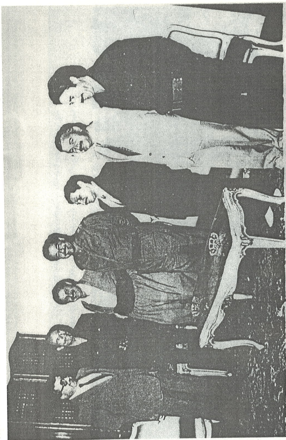
بغدا - مارچ ۱۹۸۶ - لہ راسکوه پوچھپ : علی حسن مجید ، ملازم عزمدر ، فریدون عبدالقادر ، صدام حسین ، مام جلال ، عزت دوری و دکتور فواد معصوم